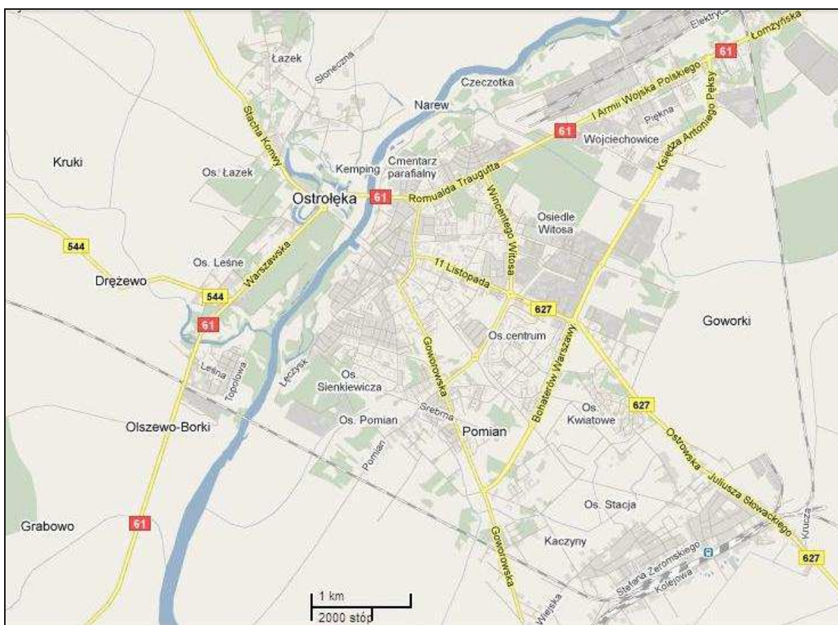
Rycina 3. Plan miasta Ostrołęka