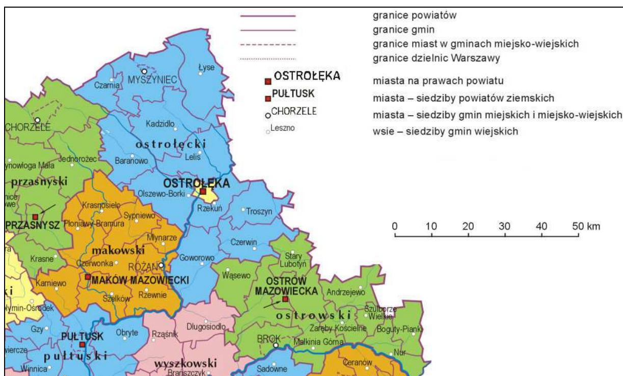
Rycina 2. Powiat ostrołęcki

W dniu 1 stycznia 1999 roku Ostrołęka znalazła się w granicach administracyjnych województwa mazowieckiego. Jest największym miastem oraz najważniejszym ośrodkiem administracyjnym i gospodarczym w północnej części regionu. Miasto jest siedzibą powiatu grodzkiego i ziemskiego. Powiat ziemski tworzy 11 rolniczych gmin: Czarnia, Myszyniec, Łyse, Kadzidło, Baranowo, Olszewo-Borki, Lelis, Rzekuń, Troszyn, Goworowo, Czerwin.