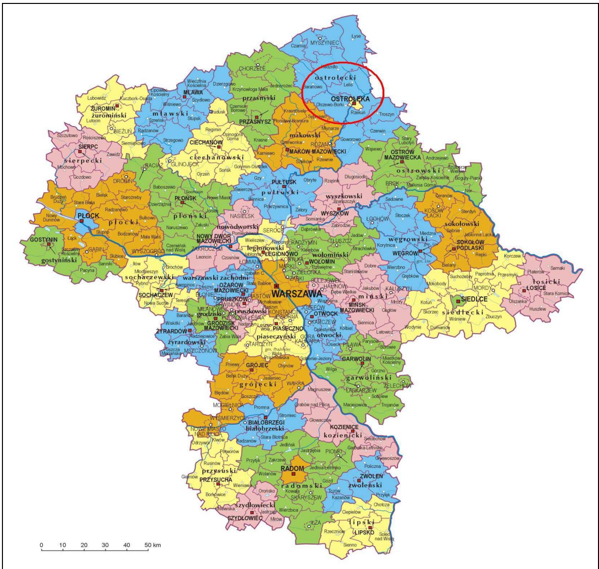
Rycina 1. Lokalizacja Ostrołęki w województwie mazowieckim